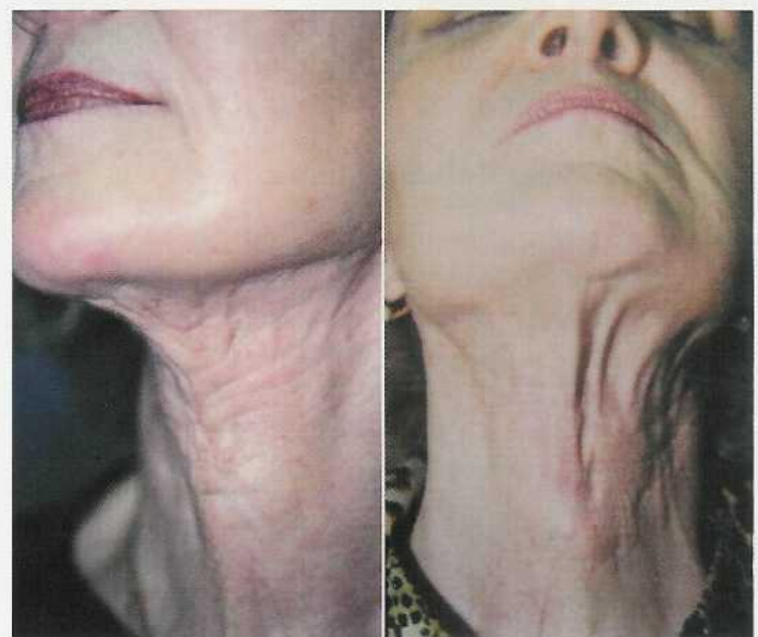
Abb. 6 und 7 Verklebungen des cervicalen Hautlappens durch zu starke Fettreduktion („Skelettierung“) und damit fehlende Gleit[Schicht, Zustand nach OP andernorts