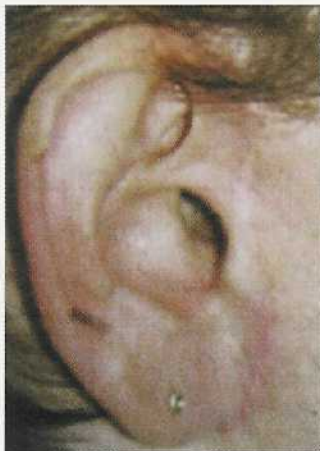
Abb. 4 Wo ist der Tragus? „Bull eye“ durch falsche Schnittführung und falsche OP-Technik, Zustand nach OP andernorts

Falsche Planung, falsche Schnitttechnik, falsche Nahttechnik, Concept of Beauty?